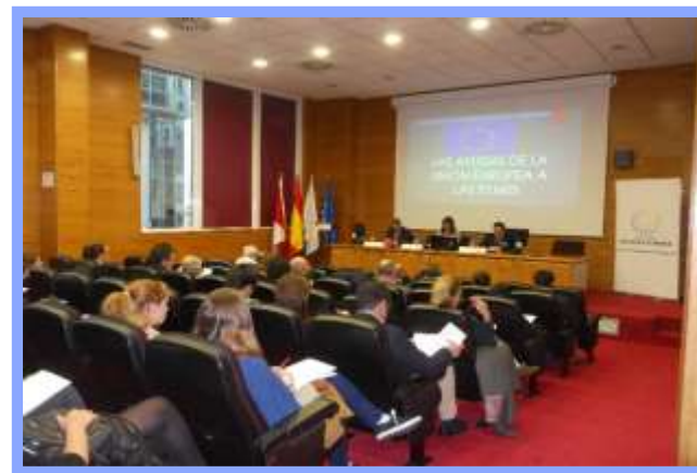
Cursos con las Cámaras de Comercio de Galicia, 2015