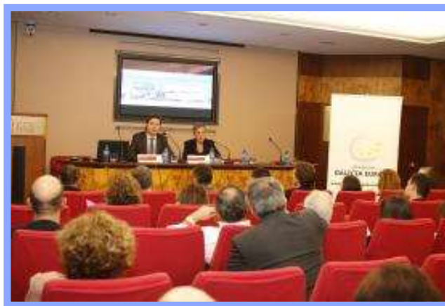
Curso con el Consorcio Zona Franca de Vigo, 2014